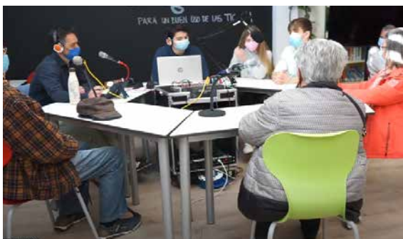
Figura 6. Tertulia intergeneracional

Aprovechamos la visita para mostrarles diferentes acciones que llevamos a cabo en el centro: concierto de música, recital de poesía y aprovechamos para intercambiar opiniones sobre las TIC, en definitiva algo tan sencillo como charlar .