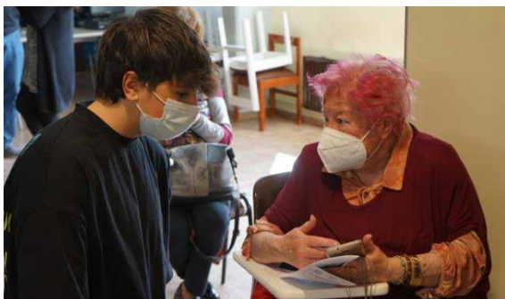
Figura 5. Curso sobre uso del móvil

En colaboración con el Hogar de Personas Mayores de Sabiñánigo el alumnado del Grado Medio de Sistemas Microinformáticas y Redes impartió un curso a los usuarios del Hogar sobre el uso del móvil y la aplicación Salud Informa .