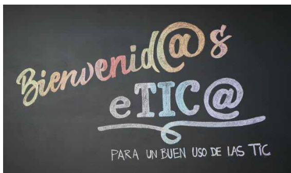
Figura 2. Bienvenid@s eTIC@

La tecnología ha cambiado nuestra sociedad y nuestro comportamiento. Ha cambiado la forma en que nos comunicamos, buscamos información o nos divertimos. Estos cambios también se reflejan en nuestro alumnado, algunos son positivos como el acceso rápido a la información o las herramientas colaborativas, pero otros no lo son: la inmediatez, la facilidad de copiar y pegar , los bulos, la pérdida de privacidad, la manipulación de la información.