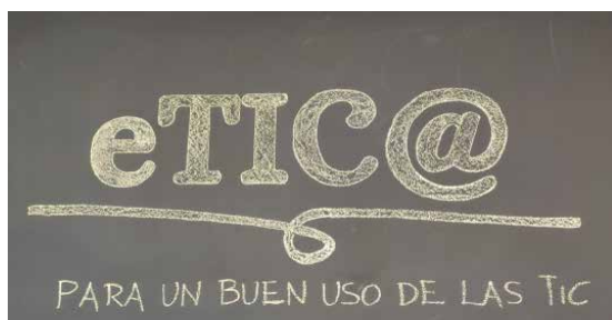
Figura 1. Logo eTIC@ SEQ Fig.0_Logo_eTIC@ \* ARABIC 1

Cada año se adelanta la edad de acceso al primer móvil y con ello el acceso a todo tipo de contenidos, legales o no, a la pérdida de privacidad, la sobreexposición, la pérdida de la autoestima, la pérdida de concentración, hiperestimulación, problemas de relaciones personales, brecha digital pero no todo en la tecnología es negativo, también es una oportunidad para crear contenidos y compartirlos, en definitiva crear una comunidad participativa, abierta y unida.